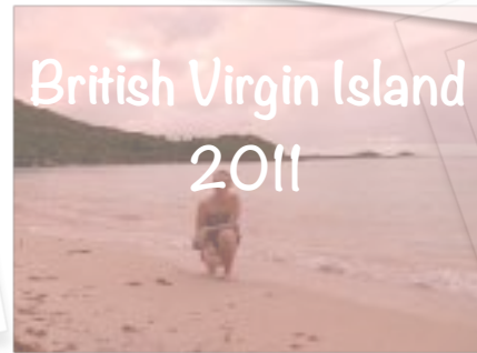
British Virgin Island 2011